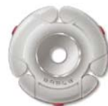
Type 1: 901A

2. 透過此次產品開發計畫，可以開創專業級三腳架新的應用領域，一是為單調呆版的專業設備用設計注入新的活力，一為將高階技術推廣應用於中低價位產品，使一般使用者也可享受高品質產品。導入鎂合金與碳纖維等新材質，應用於雲台及腳架上，預計可大幅減輕整體重量，可調